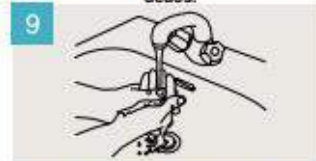
Enjuáguese las manos.