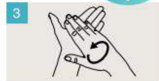
Frótese las palmas de las manos entre sí.