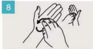
Frótese la punta de los dedos de la mano derecha contra la palma de la mano izquierda, haciendo un movimiento de rotación, y viceversa.