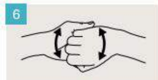
Frótese el dorso de los dedos de una mano contra la palma de la mano opuesta, manteniendo unidos los dedos.