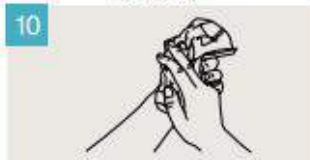
Séquelas con una toalla de un solo uso.