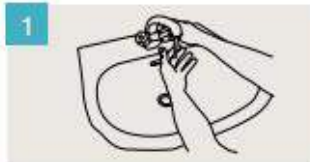
Mójese las manos.

DURACIÓN DEL LAVADO: entre 40/60 segundos