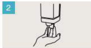
Aplique suficiente jabón para cubrir todas las superficies de las manos.