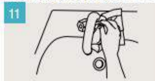
Utilice la toalla para cerrar el grifo.